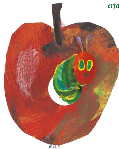
Äpfel sind die Leibspeise der Raupen des Apfelwicklers.

Kompetenzen Aufmerksamkeit und Sinne schärfen, sich selbst wahrnehmen, Sinneserfahrungen beschreiben