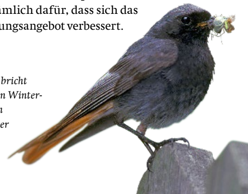
Der Hausrotschwanz bricht immer häufiger seinen Winteraufenthalt in warmen Gebieten ab, um früher nach Hause zu kommen.

Der Klimawandel hat auf das Verhalten von Zugvögeln einen Einfluss: Bei milden Wintern verkürzen manche heimische Vögel ihren Aufenthalt im Süden oder lassen ihn ausfallen. So bleiben zum Beispiel Singdrossel, Hausrotschwanz und sogar Kraniche häufiger ganzjährig in Deutschland. Zugvogelarten wie Mönchsgrasmücke und Zilpzalp kehren verfrüht zurück. Die milderen Temperaturen im Winter sorgen nämlich dafür, dass sich das winterliche Nahrungsangebot verbessert.