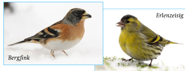
Im einen Winter kaum vorhanden, im nächsten Winter in Scharen zu beobachten – Bergfink und Erlenzeisig sind typische Invasionsvögel. Wie wird es 2015 sein?

Neben den sogenannten Standvögeln, die das ganze Jahr über bei uns bleiben, lassen sich zusätzlich Gastvögel beobachten, die im Winter aus noch kälteren Regionen im Norden und Osten nach Mitteleuropa ziehen. Bei Nahrungsengpässen tauchen in manchen Wintern in riesiger Zahl auch Invasionsvögel wie Seidenschwanz, Erlenzeisig oder Bergfink auf.