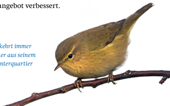
Der Zilpzalp kehrt immer häufiger früher aus seinem südlichen Winterquartier zurück.

Der Klimawandel hat auf das Verhalten von Zugvögeln einen Einfluss: Bei milden Wintern verkürzen manche heimische Vögel ihren Aufenthalt im Süden oder lassen ihn ausfallen. So bleiben zum Beispiel Singdrossel, Hausrotschwanz und sogar Kraniche häufiger ganzjährig in Deutschland. Zugvogelarten wie Mönchsgrasmücke und Zilpzalp kehren verfrüht zurück. Die milderen Temperaturen im Winter sorgen nämlich dafür, dass sich das winterliche Nahrungsangebot verbessert.