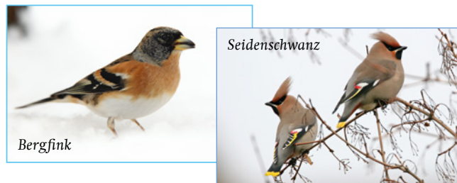
Im einen Winter kaum vorhanden, im nächsten Winter in Scharen zu beobachten – Bergfink und Seidenschwanz sind typische Invasionsvögel. Wie wird es 2016 sein?

Neben den sogenannten Standvögeln, die das ganze Jahr über bei uns bleiben, lassen sich zusätzlich Gastvögel beobachten, die im Winter aus noch kälteren Regionen im Norden und Osten nach Mitteleuropa ziehen. Bei Nahrungsengpässen tauchen in manchen Wintern in riesiger Zahl auch Invasionsvögel wie Seidenschwanz, Erlenzeisig oder Bergfink auf.