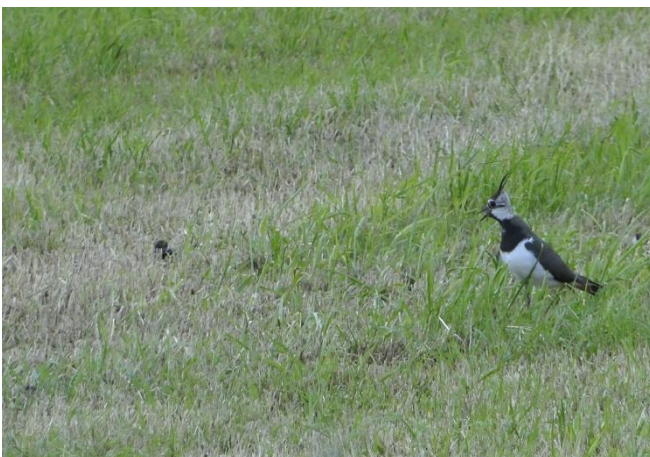
Foto 3: Wachsender, warnender Kiebitz mit Küken.