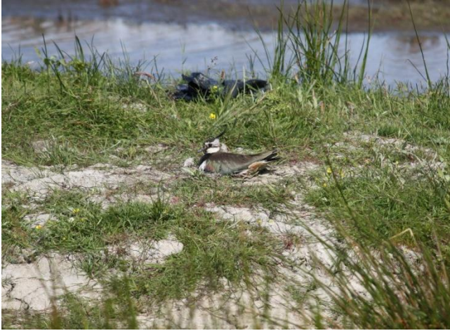
Foto 1: Brütende Kiebitze sitzen meist flach aber aufmerksam auf dem Boden.