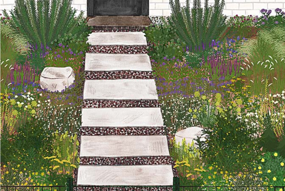
Illustration: NABU/Anne Quadflieg

Vorgärten sollen einladend aussehen, aber möglichst wenig Arbeit machen. Der Trend zu Kies und Schotter mit nur wenigen oder gar keinen Pflanzen ist in vielen Kommunen unübersehbar. Ein Trend mit negativen Folgen für Tiere, Menschen und Klima. Doch es geht auch anders. Wir stellen hier eine Alternative für einen formaleren Vorgarten an einem vollsonnigen Standort mit heimischen Wildpflanzen vor, der noch dazu wenig Pflege braucht. Hier blüht von März bis Oktober immer etwas.