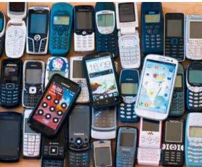
Wer sein altes Handy dem NABU spenden möchte: Es gibt NABU-Sammelboxen oder man kann es mit DHL kostenlos einsenden.