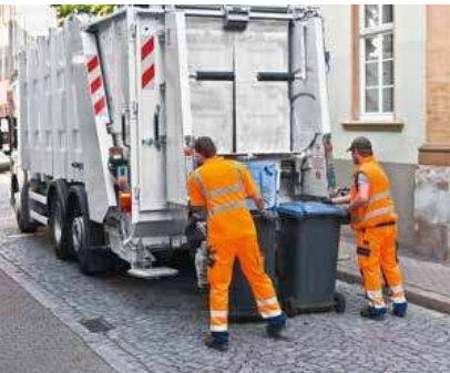
Fast 60 Prozent des Restmülls sind Verpackungen und Biomüll, die eigentlich in eine andere Tonne gehören.