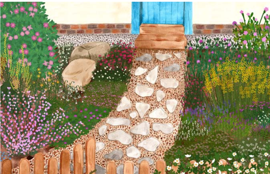
Illustration: NABU/Anne Quadflieg

Vorgärten sollen einladend aussehen, aber möglichst wenig Arbeit machen. Der Trend zu Kies und Schotter mit nur wenigen oder gar keinen Pflanzen ist in vielen Kommunen unübersehbar. Ein Trend mit negativen Folgen für Tiere, Menschen und Klima. Doch es geht auch anders. Wir stellen hier eine Alternative für einen lebendigen Vorgärten an einem vollsonnigen Standort mit heimischen Wildpflanzen vor, der noch dazu wenig Pflege braucht. Hier blüht von März bis Oktober immer etwas.