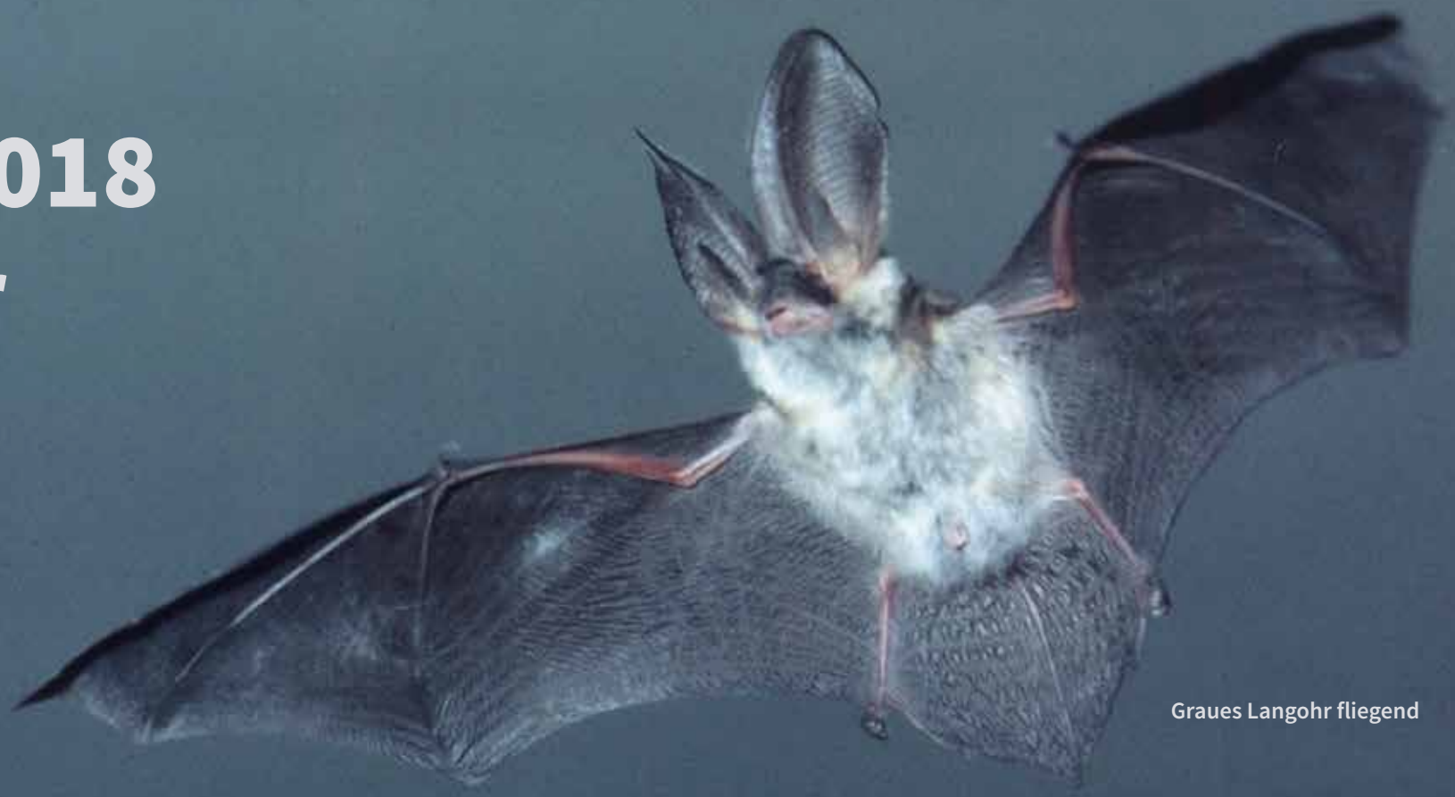
Graues Langohr fliegend