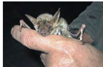
verletztes Mausohr

NABU Rheinland-Pfalz Mainzer Volksbank BLZ 551 900 00 Konto Nr. 291 154 045 Verwendungszweck: Fledermausgroßprojekt RLP