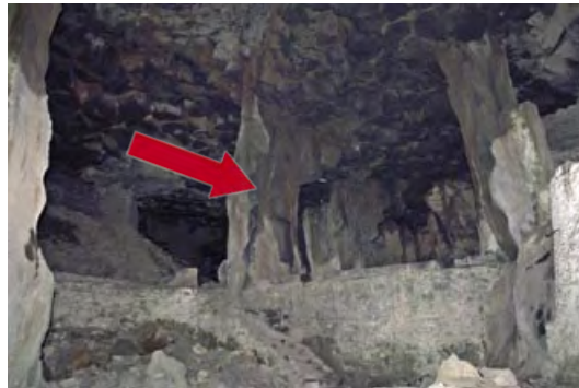
Mittlerer Teil des Bierkellers, hier vom Eingang aus fotografiert. Die nicht mehr stabile Säule ist mit einem roten Pfeil markiert.

änderungen im Mayener Grubenfeld. Einzelne Stollen fielen bei einem Erdbeben zu Beginn der 90er Jahre zusammen, andere wurden abgebaut oder verschüttet. Im Dezember 2002 ereignete sich ein Vorfall im Mauerstollen, der ohne unser Eingreifen den Tod für Tausende von Fledermäusen bedeutet hätte: Der Eingang wurde bei Abbauarbeiten zugeschüttet, die Winterschläfer waren eingeschlossen. Erst Ende Januar 2003 rückte dank unserer Bemühungen der Bagger an, um den Zugang wieder freizulegen. Auf Initiative der NABU-Gruppe Mayen wurde der Eingang des Mauerstollens dann vergittert und mit einer Lichtschranke von Karl Kugelschafter versehen. Die Fledermäuse können nun ungehindert ein- und ausfliegen, unnötige Störungen durch den Menschen unterbleiben. Und wir