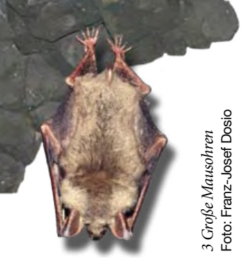
3 Große Mausohren