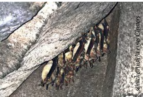
seitliche Ansicht eines Clusters

Die unterirdischen Mühlsteingruben im Mayener Grubenfeld stellen in ihrer Gesamtheit eines der bedeutendsten Fledermausquartiere Mitteleuropas dar. Betrachtet man die Stollen in Mayen und Mendig (nur 7 km Luftlinie auseinander) gemeinsam, so sind sie in der