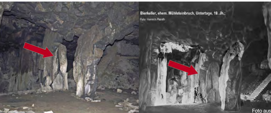
links: Mittlerer Teil des Bierkellers: die markierte Säule ist nicht mehr standfest rechts: eine historische Darstellung der gleichen Säule