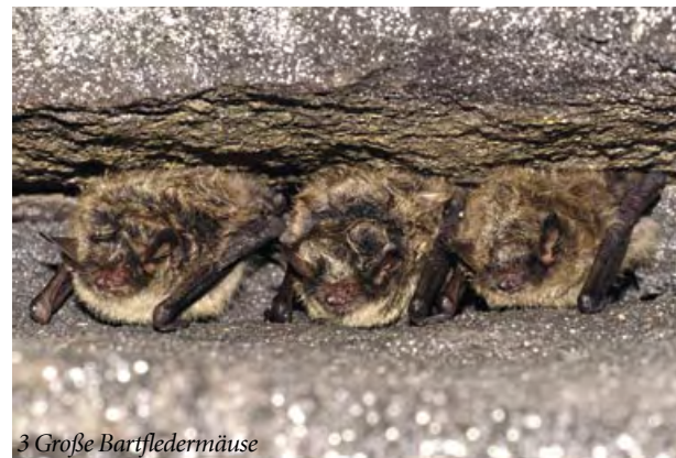
3 Große Bartfledermäuse