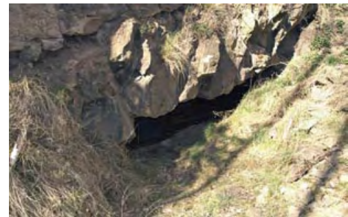
Der verschüttete Mauerstollen vor seiner Wiederöffnung im Jahr 2003 (oben) und heute nach seiner Öffnung

Die Stollen im Mayener Grubenfeld bedürfen also dringend nicht nur unserer Aufmerksamkeit sondern ganz konkreter Maßnahmen. Zunehmend ist auch festzustellen, dass sehr viele Unbefugte die Stollen im Winter begehen und ganz massiv dort die Fledermäuse stören. Aus Unwissenheit werden sogar Feuer unter den hängenden Tieren entfacht.