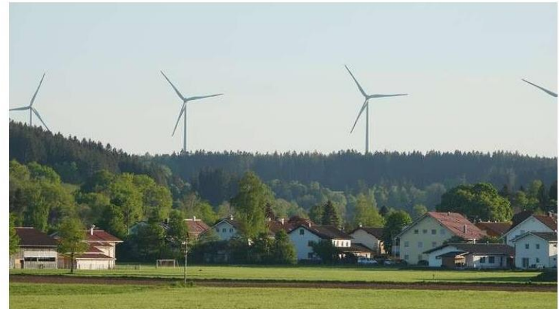
Vier Windkraftanlagen stehen im Fuchstal bereits. Für die drei geplanten soll ein Vogelmonitoring durchgeführt werden. Das Projekt hat deutschlandweit Modellcharakter.