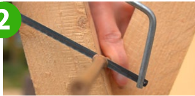
Bambus in kleine Segmente sägen, so dass diese etwas länger als die Dose sind