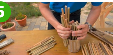
Bambusstangen straff in Dose stecken, an einem geeigneten Platz legen oder mit einem Bindfaden aufhängen